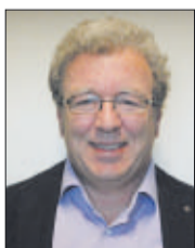
1 Klaus Harder MWK Regierungsoberamtsrat